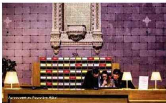
Au couvent au Fourvière Hôtel