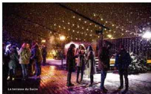
La terrasse du Sucre

Passage Thiaffait, 19, rue René-Leynaud. www.villagedescreateurs.com